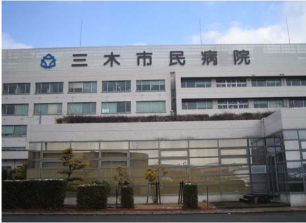
三木市民病院外観