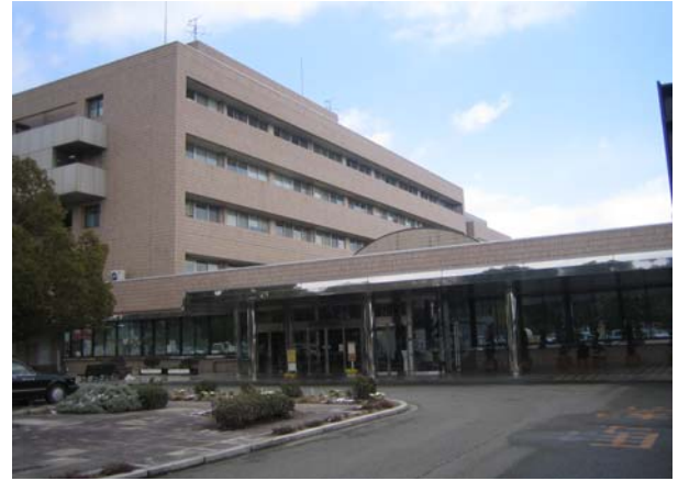
小野市民病院外観