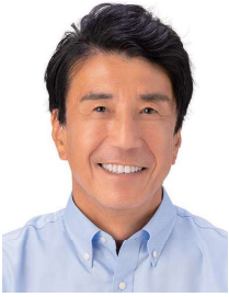
齋藤健 SAITO Ken ◎ 衆議院議員

東京大学経済学部卒業後、通商産業省入省。ハーバード大学ケネディ・スクールに留学し、修士号を取得。通商産業大臣秘書官、内閣官房行政改革推進事務局企画官、埼玉県副知事等を経て、2009年、第45回衆議院議員選挙において、初当選。現在6期。第3次安倍内閣で農林水産大臣として初入閣。農協改革やTPPなどの通商交渉に奔走した。岸田政権下では、法務大臣や経済産業大臣などを歴任。