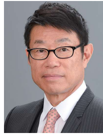
金丸恭文 KANEMARU Yasufumi ◎ フューチャー代表取締役会長兼社長 / NIRA 総研会長

米ニュージャージー州生まれ。上智大学卒業後アナウンサーとしてフジテレビに入社。夫のアメリカ赴任に伴い渡米。2000年4月より「ザ・スクープ」(テレビ朝日系)のキャスターとなる。「朝まで生テレビ!」「サンデーステーション」のキャスターなどを経て、現在は文化放送「長野智子アップデート」パーソナリティ(月~金15時半~)、国連 UNHCR 協会理事として活動中。近著に『データが導く「失われた時代」からの脱出』(河出書房新社)がある。