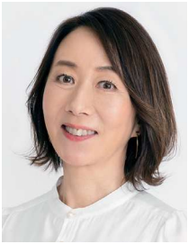
長野智子 NAGANO Tomoko ◎ キャスター・ジャーナリスト

慶応義塾大学法学部卒業後、朝日新聞経済部記者、「ハフポスト日本版」編集長を経て、ビジネス映像メディア「PIVOT」創業メンバー。海外の投資家やビジネスパーソンインタビューや、日本の課題についての英語での解説など国際発信にも力を入れる。2024年11月より現職。また「TBS CROSS DIG with Bloomberg」のCCOとして、ビジネスメディアのさらなる可能性を追求する。