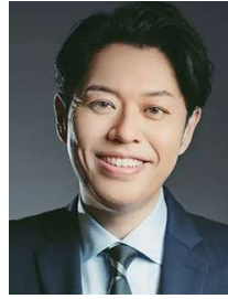
竹下隆一郎 TAKESHITA Ryuichiro ◎ TBS特任執行役員

東京大学経済学部卒業後、通商産業省入省。ハーバード大学ケネディ・スクールに留学し、修士号を取得。通商産業大臣秘書官、内閣官房行政改革推進事務局企画官、埼玉県副知事等を経て、2009年、第45回衆議院議員選挙において、初当選。現在6期。第3次安倍内閣で農林水産大臣として初入閣。農協改革やTPPなどの通商交渉に奔走した。岸田政権下では、法務大臣や経済産業大臣などを歴任。